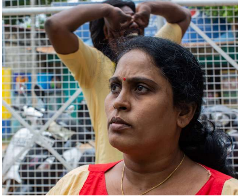
ஒத்திகையில் செம்முகம் நிகழ்ச்சிக் குழு