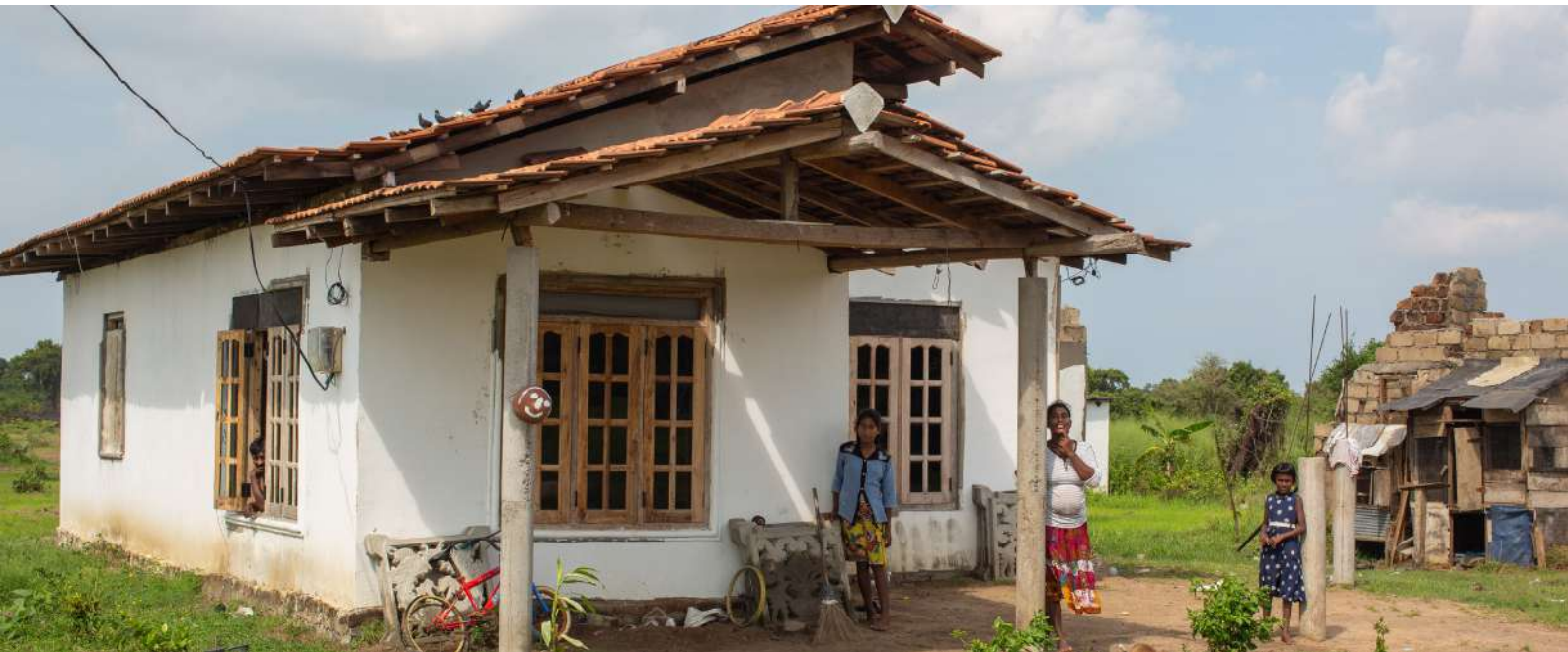
■ சுமேதங்கரபுரவாசிகள் முக்கியமாக தங்கள் நிலத்தில் விவசாயம் செய்கிறார்கள்