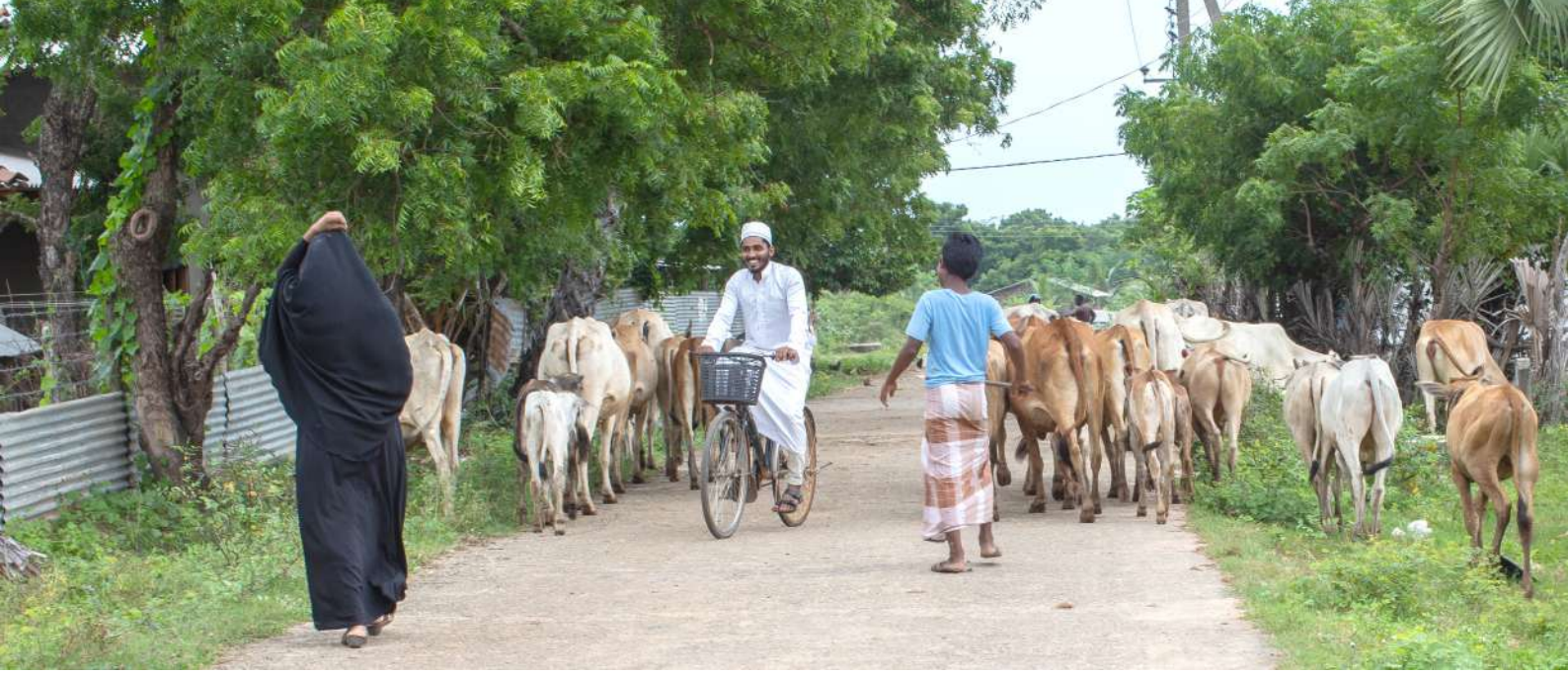
■ நாவக்கேணிக்காடு பகுதியில் மக்கள் பெரும்பாலும் கால்நடை வளர்ப்பாளர்கள்

திருகோணமலை மாவட்டத்தின் சேருவில் பிரிவு இன வேறுபாட்டிற்கு உட்பட்ட 16 எல்லைக் கிராமங்களை உள்ளடக்கியது. உதாரணமாக நாவக்கேணிக்காடு முற்றிலும் முஸ்லிம் கிராமம், சுமேதங்கரபுர சிங்கள கிராமம். சமீபத்திய ஆண்டுகளில், இரண்டு அண்டைக் கிராமங்கள் பெருகிய முறையில் முரண்பட்டன.