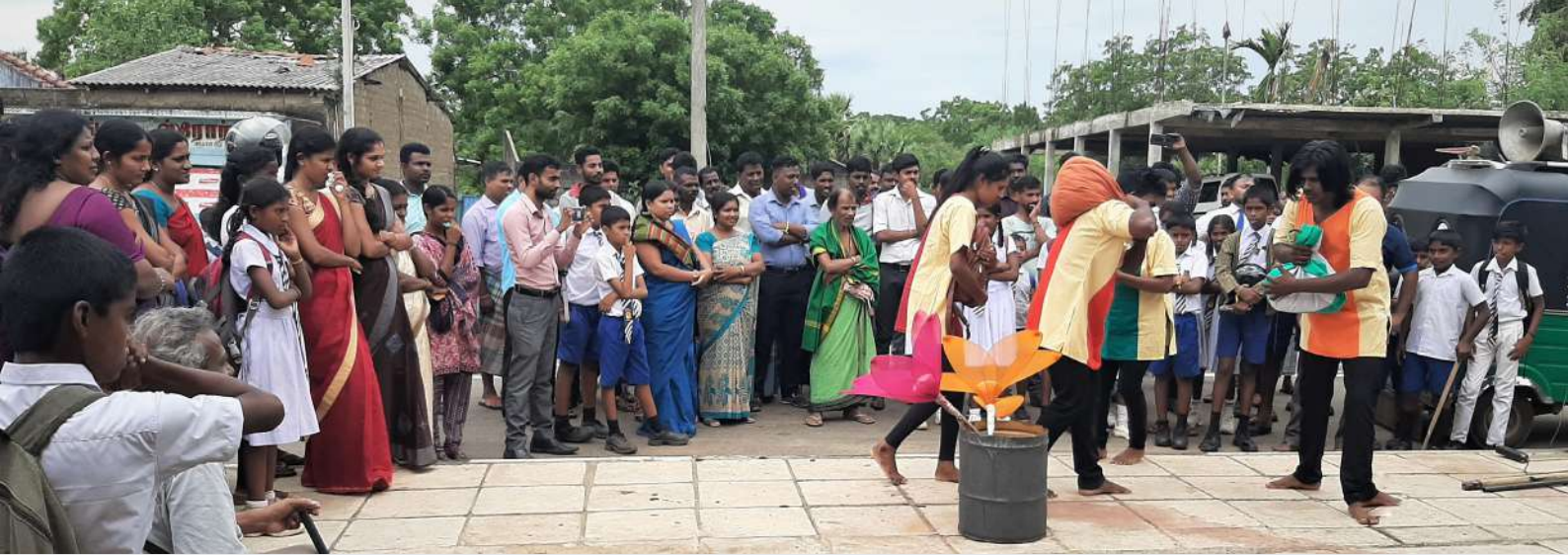
SCORE பிளவுபட்ட சமூகங்கள் ஒன்றுபடுவதற்கான முக்கியமான தேவையை நோக்கிய ஒரு சமூக தொடர்பு செயல்முறையாக தெரு நாடகத்தைப் பயன்படுத்தியது

முச்சக்கர வண்டியில் பொருத்தப்பட்டிருக்கும் ஒலிபெருக்கி அக்கம்பக்கத்தில் ஒரு தெரு நாடக நிகழ்ச்சியை அறிவிக்கிறது. சிறுவர்கள் கலந்து கொள்ள குறிப்பாக ஊக்குவிக்கப்படுகிறார்கள் - நாடகம் தொடங்கும் முன் அவர்கள் செயலாற்றல் குழுவுடன் “அமைதியை கட்டியெழுப்பும்” விளையாட்டுகளில் பங்கேற்பார்கள். பார்வையாளர்களின் அனைத்து உறுப்பினர்களும் பின்வரும் நாடகத்தில் ஈடுபட அழைக்கப்படுகிறார்கள், இது செயலாற்றல் மற்றும் அதன் செய்தி பற்றிய ஒரு சிறிய கலந்துரையாடலுடன் முடிவடையும்.