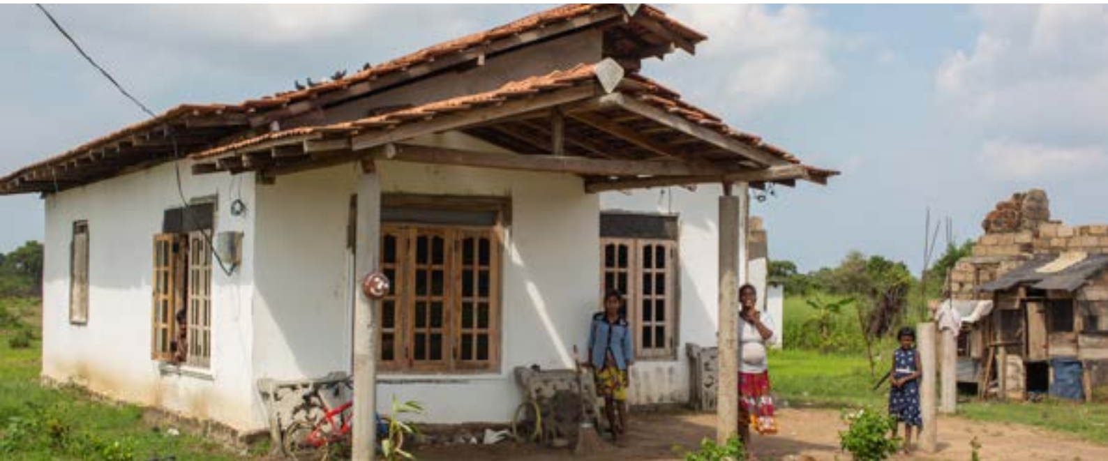
■ සුමේධංකරපුර වැසියෝ ප්‍රධාන වශයෙන් තම ඉඩම්වල ගොවිතැන් කරති.