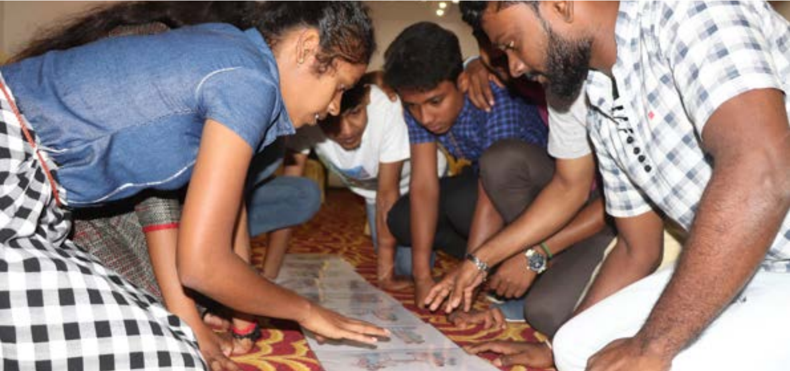
සහජීවනය පිළිබඳව අවබෝධ කර ගැනීම සහ ගැටුම් නිරාකරණය මෙම වැඩමුළුවේ වැදගත් අරමුණු දෙකක් විය

විසිතුන් හැවිරිදි නිශාමාලි ගුරුවරයන් ලෙස සුදුසුකම් ලැබීමට ජාතික අධ්‍යාපන විද්‍යා පීඨයට ඇතුළත් වීමට බලාපොරොත්තුවෙන් සිටින්නීය. "මම සහජීවනය පිළිබඳ සංවාදවලට සහභාගි වූ පළමු අවස්ථාව මේක. අපි ඉස්සර සිංහල මිනිස්සුන්ට ටිකක් බයයි. මුලදී තරමක ආතතියක් තිබුණත් දවස අවසන් වෙනකොට ඒ ඔක්කොම වෙනස් වුනා. අපි එකිනෙකා එක්ක සහභුදු වුනා වගේම එයාලට සවන් දුන්නා. මේ වැඩමුළුව කෙරුණේ ගොඩක් අමුතු විධියට - අපි බොහෝ දුරට එකිනෙකට වෙනස් ක්‍රියාකාරකම් වගේම ක්‍රීඩා හරහා ඉගෙන ගත්තා. අපි කම්මැලි නොවී උනන්දුවෙන් වැඩ කටයුතුවල නිරත වුණා."