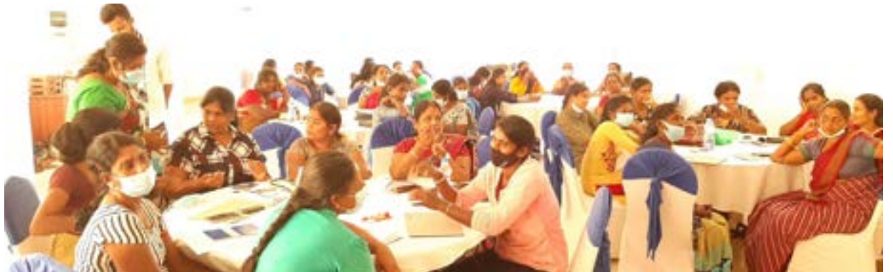
දේශපාලනයේ කාන්තා නියෝජනය ප්‍රජාතන්ත්‍රවාදයේ වැදගත් අංගයක් වන්නේ කෙසේදැයි කාන්තාවන් සාකච්ඡා කළහ

මෙම පුහුණුවට විවිධ දේශපාලන පක්ෂ නියෝජනය කරමින් ප්‍රාදේශීය සභා මන්ත්‍රීවරියන් රැසක් සහභාගී වීම විශේෂත්වයකි. මීට වසර කිහිපයකට පෙර, 2018 දී, කාන්තා කණ්ඩායම්වල වසර ගණනාවක ක්‍රියාකාරීත්වයෙන් පසුව, ශ්‍රී ලංකා රජය විසින් කාන්තාවන් සඳහා අනිවාර්ය 25% ක කෝටාවක් ක්‍රියාත්මක කරමින් පළාත් පාලන මැතිවරණය පැවැත්වීම තුළින් ප්‍රාදේශීය සභාවල කාන්තාවන් සංඛ්‍යාව 100 සිට 2000 පමණ දක්වා වැඩි කිරීමට හැකිවිය. මෙය රටේ දේශපාලනය තුළ සම මට්ටමේ අවස්ථා නොමැති බව පෙන්නවන පිරිමින්ගේ ආධිපත්‍යය පැතිරුණු තැනක් බවට පැහැදිලිව පිළිගැනීමක් විය. කෙසේ වෙතත්, කෝටාව යනු දේශපාලනයේ කාන්තාවන්ට සිදුවන අවාසිය සලකා ප්‍රජාතන්ත්‍රවාදී ක්‍රියාවලීන්හි ඔවුන් කොන් කිරීම යන යතාර්ථය කල්තියා හඳුනාගෙන එම ගැටළුව ආමන්ත්‍රණය කිරීම සඳහා තාවකාලිකව ගනු ලැබූ පියවරක් වේ. එසේම මේ තත්වය මෙරට වත්මන් සහ අනාගත පිරිමි මන්ත්‍රීවරුන් අතර ප්‍රතිවිරෝධතා ඇති කිරීමටද හේතු වී ඇත.