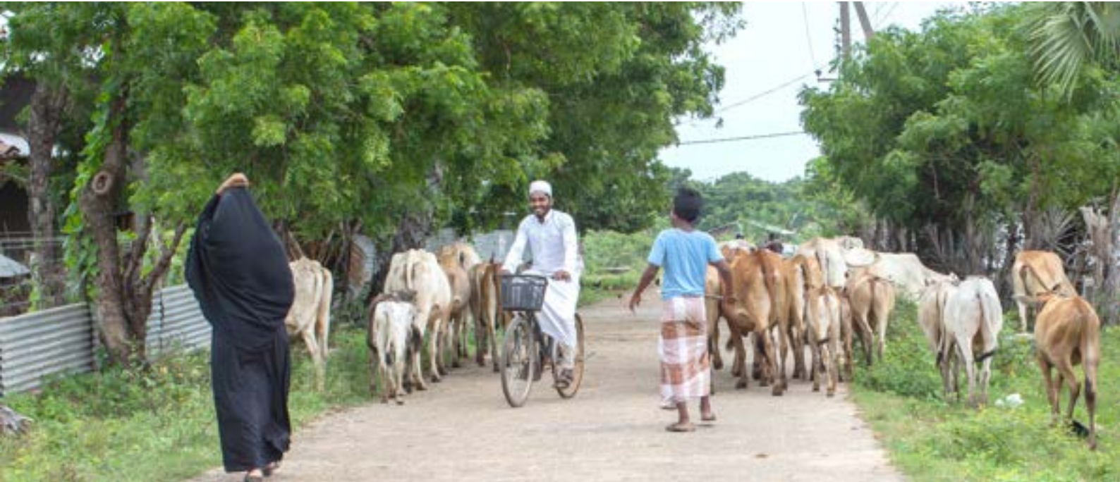
■ නාවක්කේනිකාඩු ප්‍රදේශයේ ජනතාව ප්‍රධාන වශයෙන් සත්ව පාලනයේ නියැලෙන්නන් ය.

ත්‍රිකුණාමලය දිස්ත්‍රික්කයේ සේරුවිල කොට්ඨාශය ජනවාර්ගික වශයෙන් විභේදනය කළ හැකි මායිම් ගම්මාන 16 කින් සමන්විත වේ. උදාහරණයක් ලෙස නාවක්කේනිකාඩු සම්පූර්ණයෙන්ම මුස්ලිම් ගම්මානයක් වන අතර සුමේධංකරපුර සිංහල ගම්මානයකි. මෑත වකවානුවේදී එම අසල්වැසි ගම්මාන දෙක අතර වඩ වඩාත් ගැටුම්කාරී තත්වයන් ඇති විය.