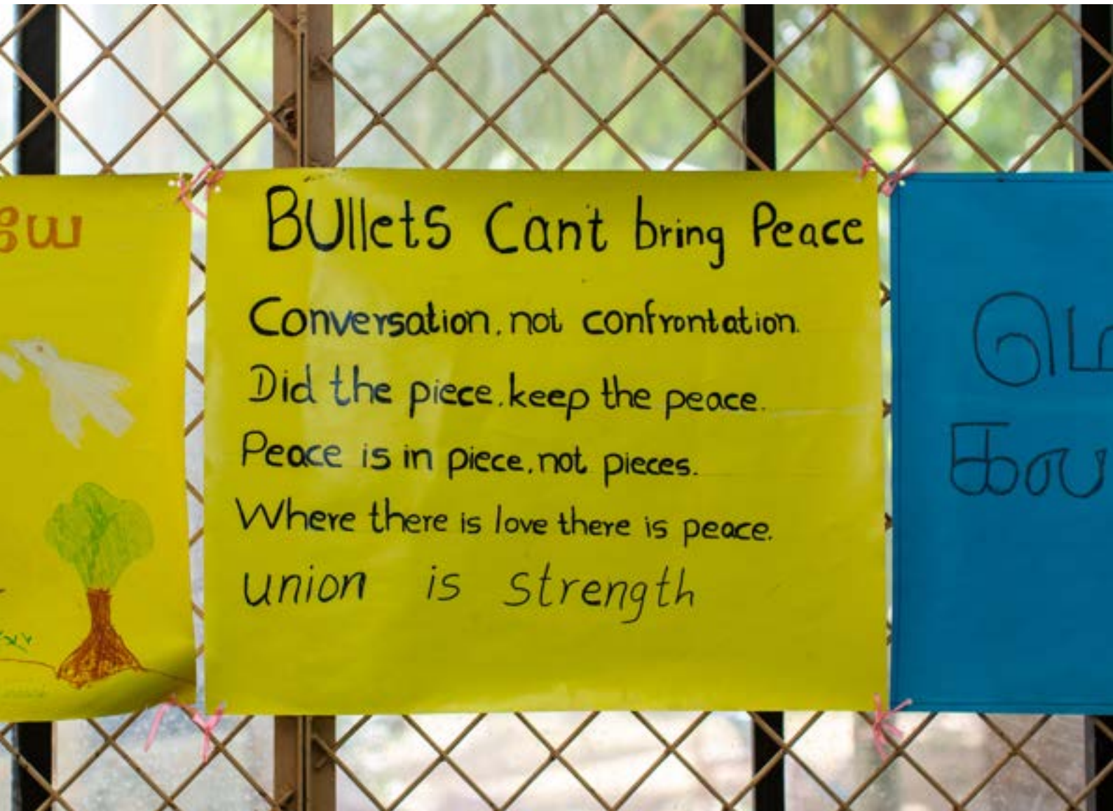
■ අවිහිංසාවාදී සන්නිවේදනය විෂයෙහි පෝස්ටර් පන්ති කාමරවල ස්ථිර අංග බවට පත්ව ඇත