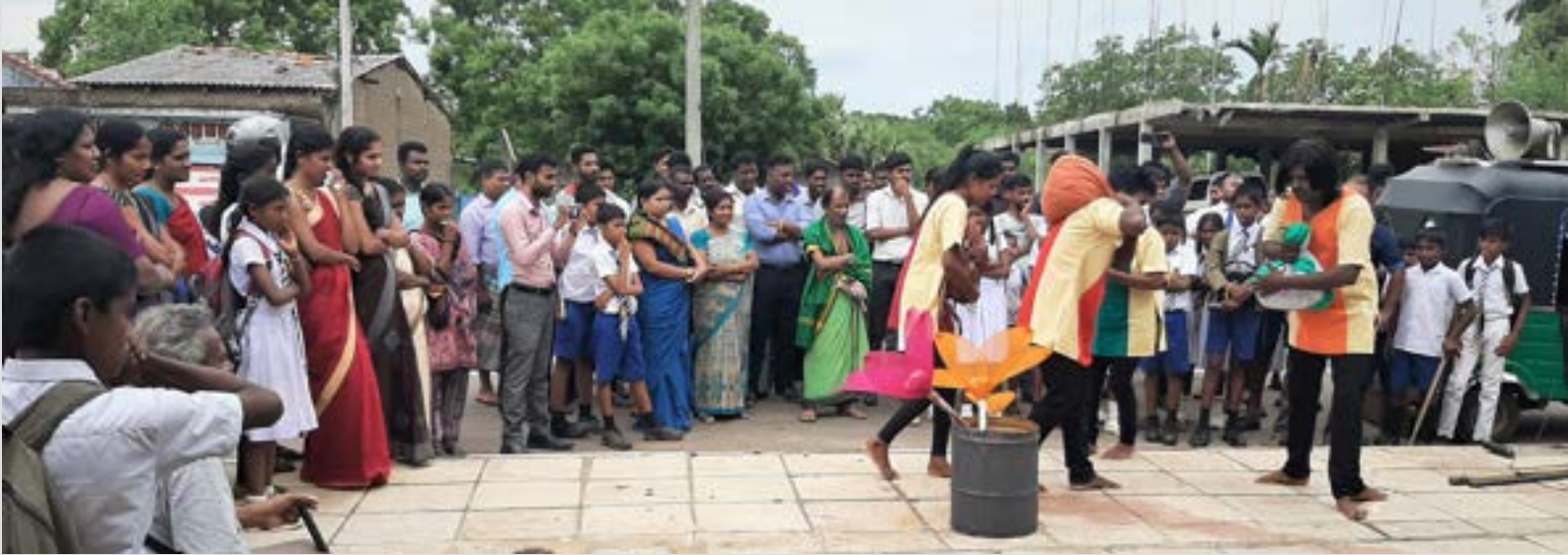
SCORE සමාජ සන්නිවේදන ක්‍රියාවලියක් ලෙස විදි නාට්‍ය භාවිතා කරනු ලැබුවේ බෙදී වෙන්වූ ප්‍රජාවන් එක්සත් කිරීමේ තීරණාත්මක අවශ්‍යතාවය සපුරාලීමටය

අසල්වැසි ප්‍රදේශයේ විදි නාට්‍ය ප්‍රසංගයක් සිදුකරන බැව් ත්‍රිරෝද රථයක සවිකර ඇති ශබ්ද විකාශන යන්ත්‍රයකින් නිවේදනය කරයි. මෙහිදී ළමයින්ට සහභාගී වීමට විශේෂයෙන් දිරිගන්වනු ලැබිණි. නාට්‍යය ආරම්භ වීමට පෙර ඔවුන් නාට්‍ය කණ්ඩායම සමඟ 'සාමය ගොඩනැගීම සම්බන්ධ' ක්‍රීඩා වලට සහභාගී වනු ඇත. රංගනය සහ විහි පණිවිඩය පිළිබඳ කෙටි සාකච්ඡාවකින් අවසන් වන ඊළඟ නාට්‍යයත් රස විඳින ලෙසට සියලුම ප්‍රේක්ෂක සාමාජිකයින්ට ආරාධනා කෙරේ.