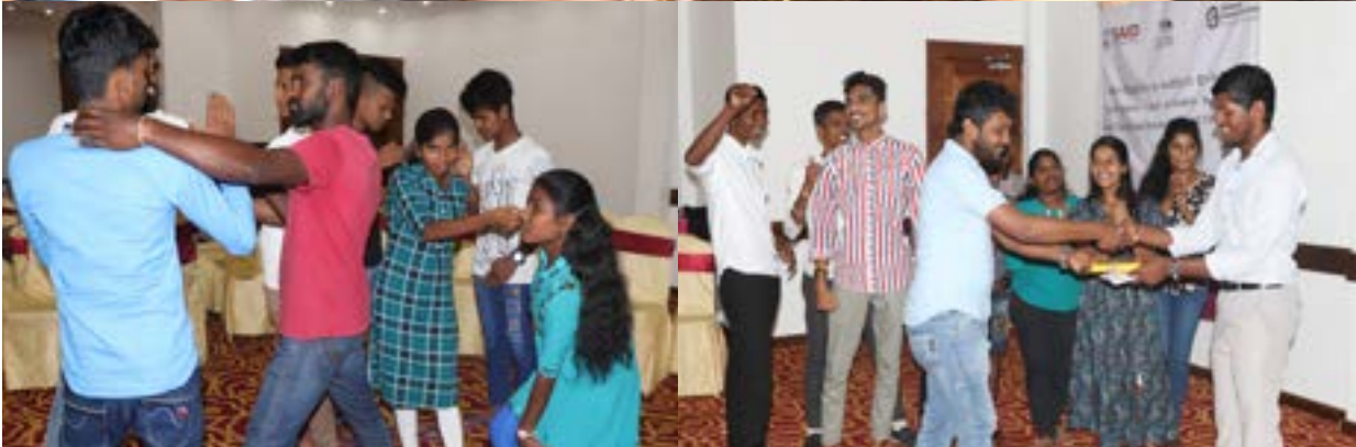
■ සහකාරී වූ බොහෝ දෙනෙකුට මෙම වැඩමුළුව සම්පූර්ණයෙන්ම නව අත්දැකීමක් විය