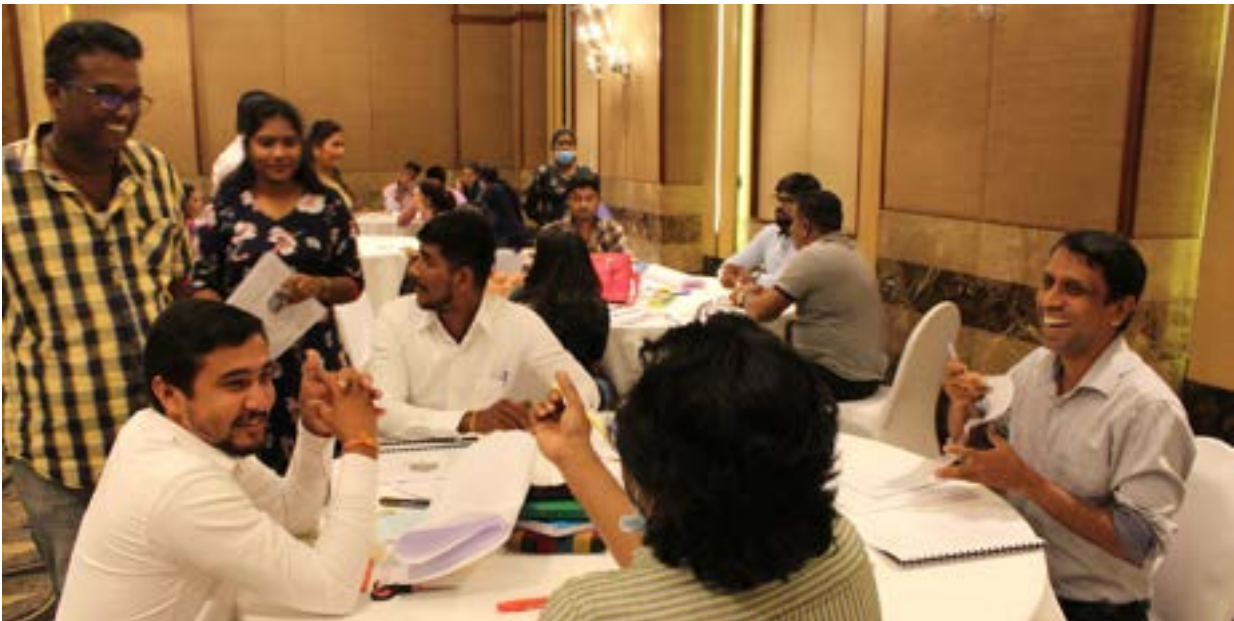
දින තුනක පුහුණුකරුවන් පුහුණු කිරීමේ වැඩමුළුව සඳහා දිස්ත්‍රික්ක පහක සාමාජිකයන් සහභාගී විය ‘දිනපතා ප්‍රජාතන්ත්‍රවාදය හරහා ඕරොක්කු දෙන ප්‍රජාවන්’

මුලතිව්, මොණරාගල, වවුනියාව, අම්පාර සහ මඩකලපුව දිස්ත්‍රික්කවල සමාජ ඒකාබද්ධතා සහ සංහිඳියාව (SCORE) වැඩසටහනේ හවුල්කාර සංවිධානවල සාමාජිකයින් විසි දෙනෙකු සඳහා “දිනපතා ප්‍රජාතන්ත්‍රවාදය හරහා ඕරොක්කු දෙන ප්‍රජාවන්” පුහුණු මොඩියුලය පිළිබඳ තෙදින වැඩමුළුවක් 2020 අගෝස්තු මාසයේදී පැවැත්විණි. අන්තර්ක්‍රියාකාරී මෙවලම් සහ ශිල්පීය ක්‍රම භාවිතා කරන ලද එම පුහුණුව වැඩිහිටියන් සඳහා වූ ඉගෙනුම් මුලධර්ම මත පදනම් විය. ජීවිත අත්දැකීම් ඇදා ගනිමින් ප්‍රජාතන්ත්‍රවාදයේ විවිධ පැතිකඩ වලදායීව සංවාදයට ලක් කරමින් සැබෑ ජීවිතයේ අත්විඳින තත්වයන් සඳහා නව දැනුම භාවිතයේ යෙදීම කෙරෙහි මෙම පුහුණුවේදී අවධානය යොමු කිරීම සිදු කෙරිණි.