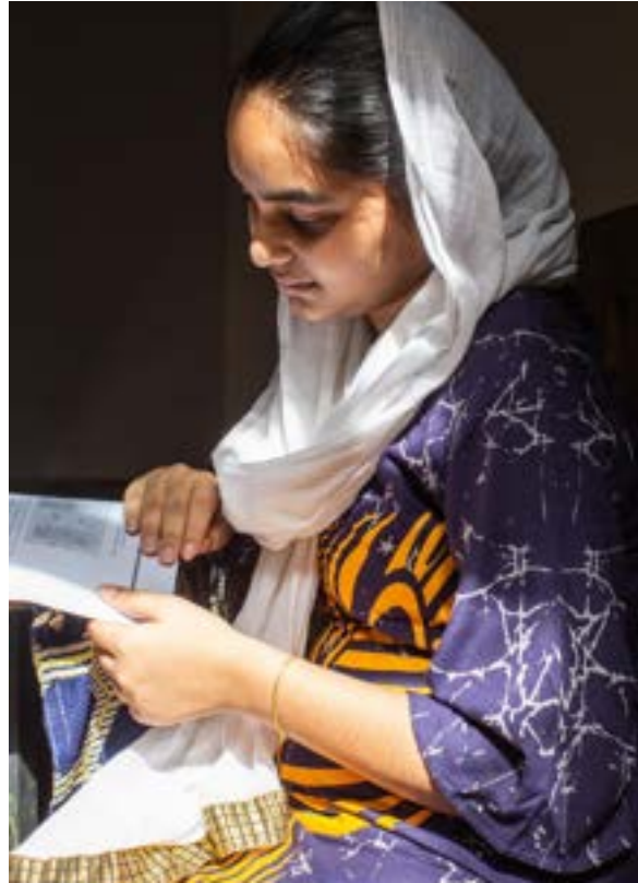
ගාහිමා පුස්තකාලය දකින්නේ ඇයව හිඳහස් කරන ස්ථානයක් ලෙසයි

ශ්‍රී ලංකාවේ නොසැලකිල්ලට ලක්වූ දිස්ත්‍රික්කයක් වන මොණරාගල පිහිටි බුත්තල ප්‍රාදේශීය ලේකම් කොට්ඨාශයේ මහසෙන්පුර ග්‍රාමයට පුස්තකාලයක් නැත. නමුත් උදාර විශේෂයෙන් සතුටට පත්ව සිටින්නේ 2020 මාර්තු මාසයේදී පැල්වත්තේ තම පාසලට යාබදව පිහිටි පුස්තකාලයට ප්‍රදානය කරනු ලැබූ ප්‍රබන්ධ, වර්තාපදාන, සංස්කෘතිය සහ සමාජය ආදී පුළුල් විෂයපථයන්ගෙන් යුත් සිංහල, දෙමළ සහ ඉංග්‍රීසි මාධ්‍ය පොත් මගින් ප්‍රතිලාභ ලැබීම නිසාය. මෙය ජාතික සාම මණ්ඩලය විසින් මොණරාගලදී ක්‍රියාත්මක කරන ලද සමාජ ඒකාබද්ධතාවය සහ සංහිඳියාව (SCORE) වැඩසටහනේ මුලපිරීමකි. තවදුරටත් ඔහු පැහැදිලි කරන්නට යෙදුනේ “මිනිසුන්ට පොත් ලබා දීම එතරම් විශේෂ වූ දෙයක්, දුරස්ථ ප්‍රදේශවල පුස්තකාල හිඟයි, මිනිසුන් පවතින ඒවා වෙත ආකර්ෂණය වීම හිතැතින් සිදුවන දෙයක්” යනුවෙනි.