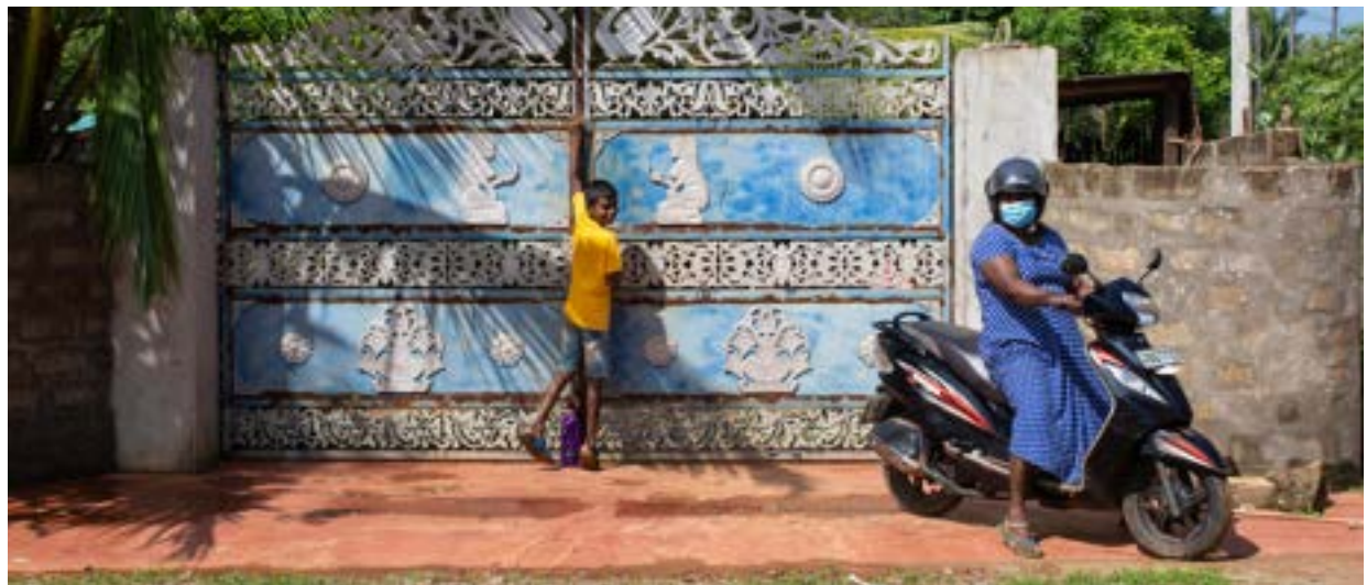
වසර ගණනාවක් අවතැන්ව සිටි ජනතාව හැටහ තම ගම්බිම් බලා යන ලදී

1990 ගණන්වල මුල් භාගයේ සිට, ශ්‍රී ලංකාවේ උතුරු සහ නැගෙනහිර පළාත්වල වාසය කල ලක්ෂයකට අධික ජනතාවට තම නිවෙස් හැර යාමට සිදු වූයේ සන්නද්ධ හමුදා විසින් රාජ්‍ය හා පෞද්ගලික දේපළ හතූ කරගැනීමත් සමඟය. මිනිසුන්ට ජීවත් වන්නට සිදුවූයේ සරණාගත කඳවුරු, තාවකාලික නිවාස හෝ දුර බැහැර ප්‍රදේශවල සිටි ඥාතීන් සමඟ අවිනිශ්චිත තත්ත්වයක ය.